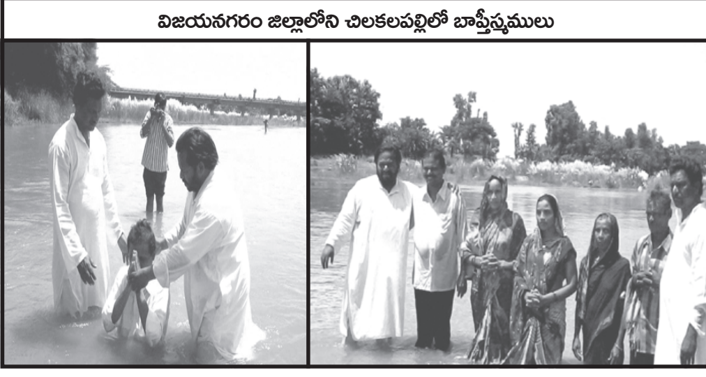
విజయనగరం జిల్లాలోని చిలకలపల్లిలో బాప్టిస్టుములు