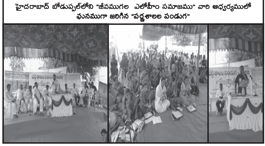
హైదరాబాద్ బోడువల్లోని “జీవముగల ఎలోహీం సమాజము” వారి ఆధ్వర్యములో ఘనముగా జరిగిన “పర్వశాలల పండుగ”