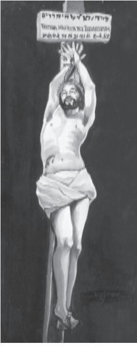
(సంఖ్యా 21:8,9 యోహాను 3:14,15)