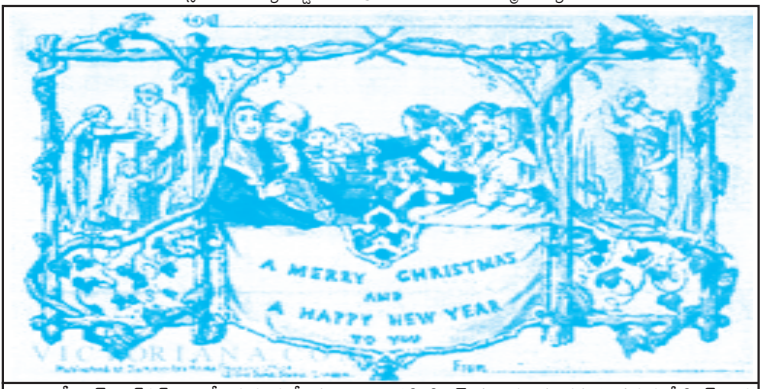
1843లో జాన్ కాలకట్ హూడ్నే తయారుచేసిన మొట్టమొదటి క్రీస్మస్ మరియు నూతన సంవత్సర గ్రీటింగ్ కార్డు

గ్రీటింగ్ కార్డు :- 1843లో జాన్ కాలకట్ హూడ్నే అనే ఇంగ్లీష్ చిత్రకారుడు మొట్టమొదటిసారిగా క్రీస్మస్ కార్డు తయారుచేసాడు. ఆ సంవత్సరము వెయ్యికార్డులు మాత్రమే లండన్ లో అమ్ముడయ్యాయి.