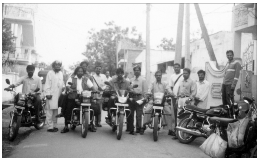
భద్రాచలం నుండి సీలేరు, డొంకరాయి, చింతపల్లి, పాడేరు మొదలగు ప్రాంతములకు సువార్త నిమిత్తమై బయలుదేరుచున్న సమయంలో